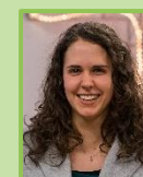
von Natalie Seitz

Am späten Abend konnte man den Tag am Feuer mit frisch frittierten Pommes oder einem Slush-Eis ausklingen lassen. Der Gottesdienst am Sonntag war auch für das EC-Camp etwas Besonderes, weil dort erstmalig Taufen stattfanden. Sechs junge Menschen ließen sich an diesem Tag taufen und haben sich so öffentlich zu Jesus bekannt. Es berührt mich immer wieder zu Herzen so etwas miterleben zu dürfen. Ich danke Jesus und allen Mitarbeitern für das EC-Camp, denn es war eine wirklich wertvolle Zeit.