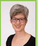
von Birgit Hartmann