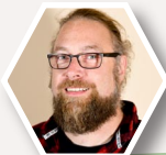
von Stefan Kaiser

Am Ende der Woody Town Aktion trafen sich alle zu einem Familiengottesdienst unter Hygieneschutzbedingungen in Weiterstadt. Alle Familien saßen auf mitgebrachten Picknickdecken und genossen die Zeit, sowie die Siegerehrung der Challenge-Gewinner. Natürlich wurde in diesem Familiengottesdienst auch mit Klötzen gespielt. Also: Rundum eine tolle Aktion und den Familien tat das mal wieder richtig gut.