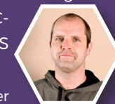
von Johannes Belger

Wir hatten bereits unsere reguläre VV am 06.03.21. Eine weitere VV wurde nun für eine Satzungsänderung benötigt, um unsere weitere Arbeit im Zusammenschlussprozess möglich zu machen. Einerseits muss unser Verein für die Verwaltung unseres EC-Freizeitheims in Allertshofen weiterhin bestehen bleiben, (auf unserer VV am 22.08.20 haben wir dazu bereits berichtet, dass das Freizeitheim wegen einer Grundschuld bis Ende 2024 weitergeführt werden muss), andererseits sollen unsere Jugendarbeiten, die die Mitglieder unseres Vereins darstellen, zum neu entstehenden EC-West wechseln. Daher haben wir eine Satzungsänderung entworfen, damit ab jetzt auch Einzelmitglieder in den EC-RMS eintreten können. Diese wurde von unserer VV einstimmig beschlossen und wird vom Amtsgericht nun entsprechend überprüft. Den Jugendarbeiten ist es dann möglich in den EC-West zu wechseln, ohne dass uns sämtliche Leute fehlen, um für das Freizeitheim Sorge zu tragen. Es besteht übrigens auch die Möglichkeit, dass Jugendarbeiten im EC-West Mitglied werden, aber gleichzeitig bewusst bei uns im EC-RMS bleiben, um unsere Arbeit mit dem Freizeitheim zu unterstützen.