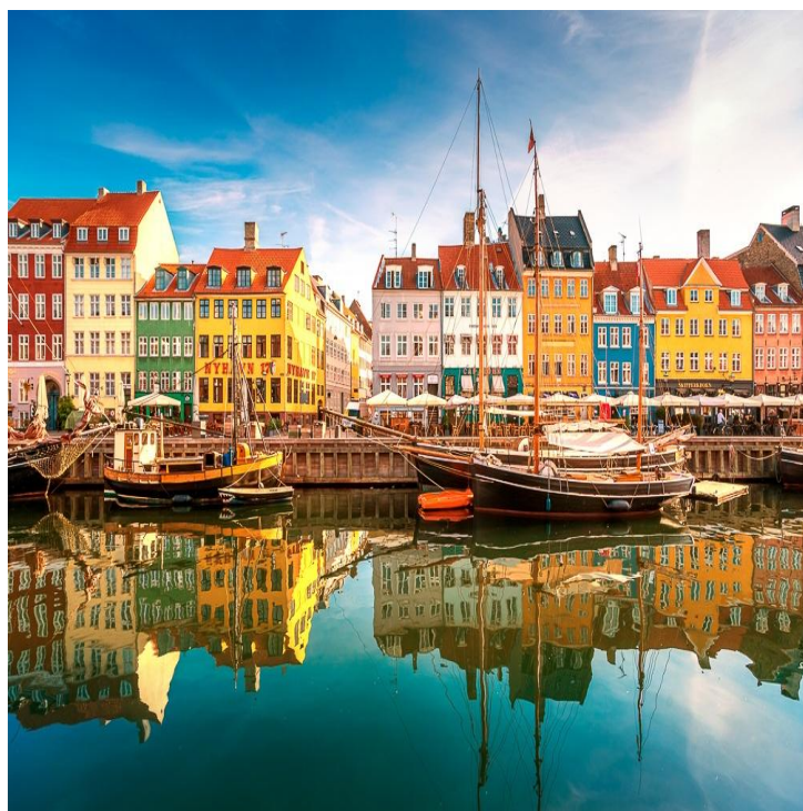
Typische Szene in Kopenhagen

Alleinreisende sind herzlich willkommen! Einzelzimmer sind immer möglich. Falls gewünscht, manchmal sogar ½ DZ.